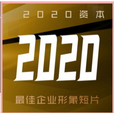
绿色发展贡献自己的一份力量。

公司在螺杆式压缩机领域拥有雄厚的技术实力, 同时, 作为工信部评定的国家级“绿色工厂”, 公司秉持着“创造更低碳环保的生活环境”的使命, 在煤改电、光伏、半导体、燃料电池等多个新能源环保领域积极布局, 为世界的绿色发展贡献自己的一份力量。